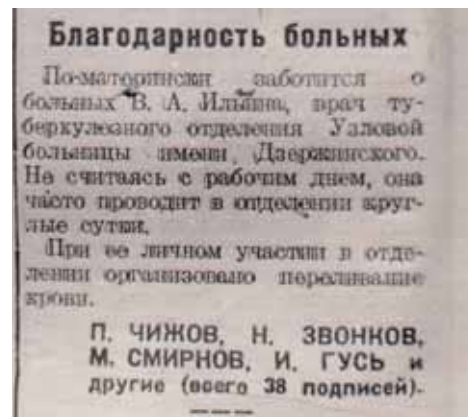
Благодарности больных в газете «Сталинец»